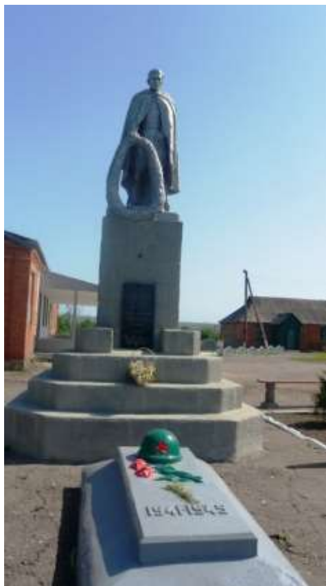
Пам'ятник загиблим воїнам с.Кіндратівка (вигляд до реставрації)

Актуальність теми. Характерним явищем сучасного культурного процесу став підвищений інтерес усіх верств суспільства до історичного минулого, джерел своєї історії, боротьби українського народу за здобуття незалежності. Важливе місце в цих процесах відіграє культурна спадщина, яка збереглася до наших днів у вигляді різноманітних об'єктів, що мають універсальну історичну, наукову, культурну і мистецьку цінність. Це, передусім, нерухомі пам'ятки археології, історії, архітектури, містобудування, монументального мистецтва, науки і техніки, в яких зафіксовані важливі події в історії держави, окремого регіону, міста, села, конкретної людини. Відтворюючи етапи