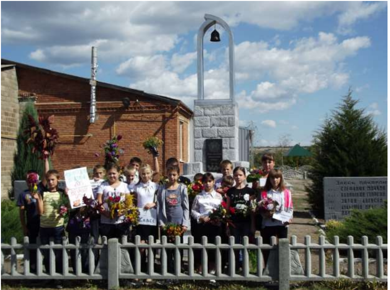
Меморіал загиблим воїнам с.Кіндратівка (2015 рік вигляд після реставрації)